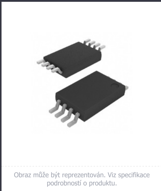
Obraz může být reprezentován. Viz specifikace podrobností o produktu.