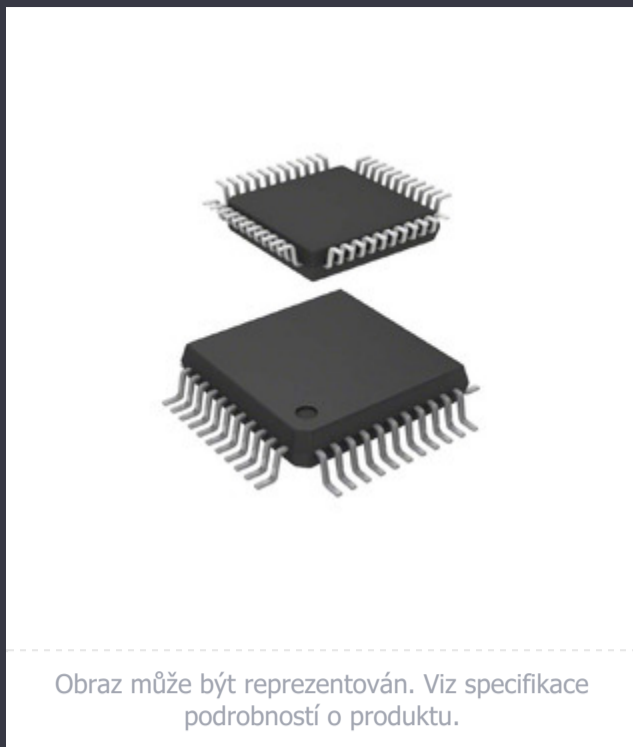
Obrázek může být reprezentován. Viz specifikace podrobností o produktu.